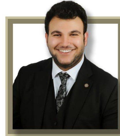
AV. RACİ YÜKSEKBAŞ

İş Hukukunda Sözleşme Şartlarında Esaslı Değişiklik