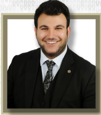
AV. RACİ YÜKSEKBAŞ