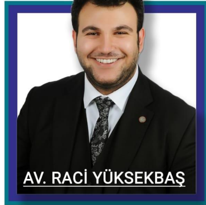
AV. RACİ YÜKSEKBAŞ