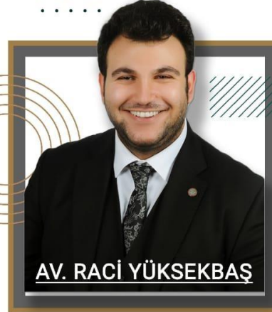
AV. RACİ YÜKSEKBAŞ

İş Akdinin Feshi İş Akdinin Fesih Sebepleri