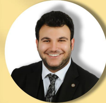
AV. RACİ YÜKSEKBAŞ