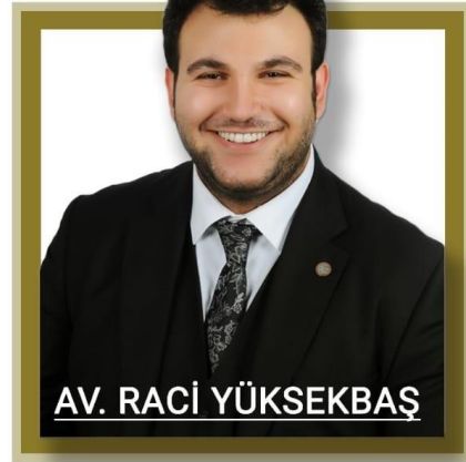
AV. RACİ YÜKSEKBAŞ