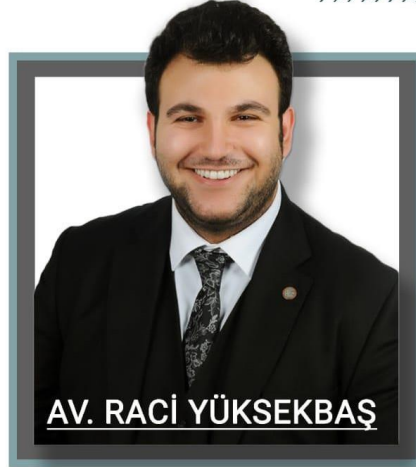
AV. RACİ YÜKSEKBAŞ