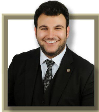
AV. RACİ YÜKSEKBAŞ